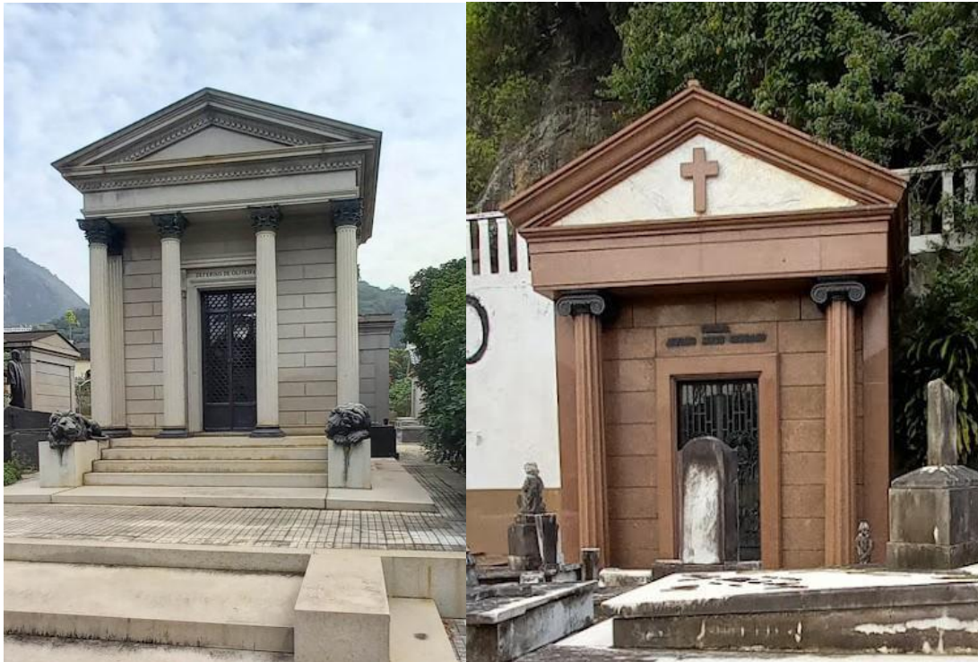
Figura 5: Mausoléus-Capela Neoclássicos.