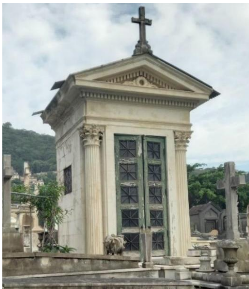
Figura 8: Mausoléu-Capela Neoclássico.