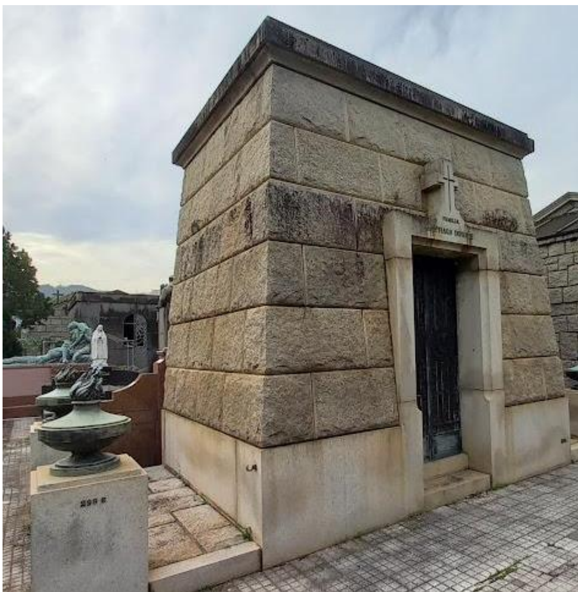
Figura 10: Mausoléu-Capela Eclético.

Outra descoberta arqueológica foi responsável por referências ao Egito, tanto no estilo Eclético quanto no Art Déco , que viria a seguir: a tumba do faraó Tutancâmon, no Vale dos Reis, em 1922 (Duncan, 1988). O Mausoléu-Capela (Figura 10) imita as paredes inclinadas dos templos egípcios (pilones, um tipo de pórtico em forma de pirâmide truncada). O edifício em pedra é simples e pequeno e tem um letreiro sobre a porta (Família Santiago Infante), com moldura em relevo e um crucifixo em pedra. Nas quatro laterais, vasos de pedra colocados sobre um pedestal, com uma chama estilizada, em pedra.