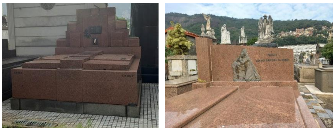
Figura 16 (a e b): Túmulos Art Déco.

A figura 16 apresentam dois túmulos mais simples, o do lado esquerdo com escalonamento e planos superpostos, com relevo e inscrições, em granito avermelhado. O do lado direito, da Família de Antônio Teixeira da Cunha, mostra uma composição geométrica, com frisos superpostos numa das laterais. Contém relevos e inscrições e está revestido em granito avermelhado.