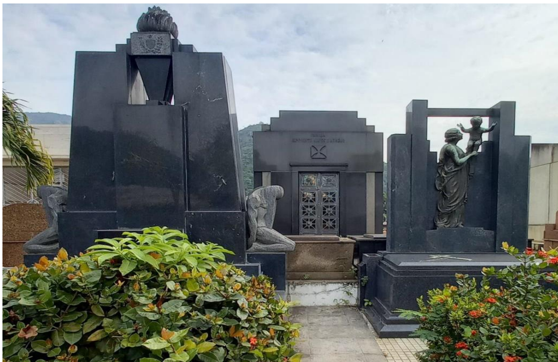
Figura 20: Mausoléu-Monumento, Mausoléu-Capela e Túmulo Art Déco .