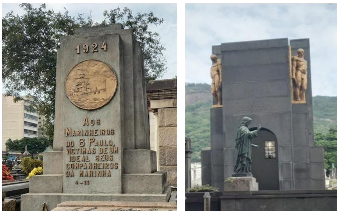
Figura 14 (a e b): Mausoléus-Monumento Art Déco.

Na Figura 14 (a e b), dois jazigos do tipo Mausoléu-Monumento, ambos da Marinha do Brasil (Barthel; Ramos, Castro, 2020). O do lado esquerdo, de 1924, homenageia os mortos do encouraçado São Paulo. Tem planos superpostos e escalonamento e no medalhão se representa a embarcação, que depois foi replicada em uma medalha comemorativa. O do lado direito tem estátuas de figuras masculinas do escultor Hildegardo Leão Velloso (Piovesan; Grassi, 2014), homenageia os marinheiros da Divisão Naval em Operações de Guerra, também com escalonamento, superposição de planos e simetria. Construído em 1928, em alvenaria, revestido em placas de granito, guarda os restos mortais de cento e cinquenta brasileiros mortos na Primeira Guerra Mundial, que se encontravam sepultados no cemitério de Dacar, capital do Senegal, na África, sendo transferidos para este cemitério e que não se encontram identificados, apenas os nomes dos navios, que foram abatidos em operações de guerra. Pode-se entrar neste Mausoléu-Monumento, há uma área interna.