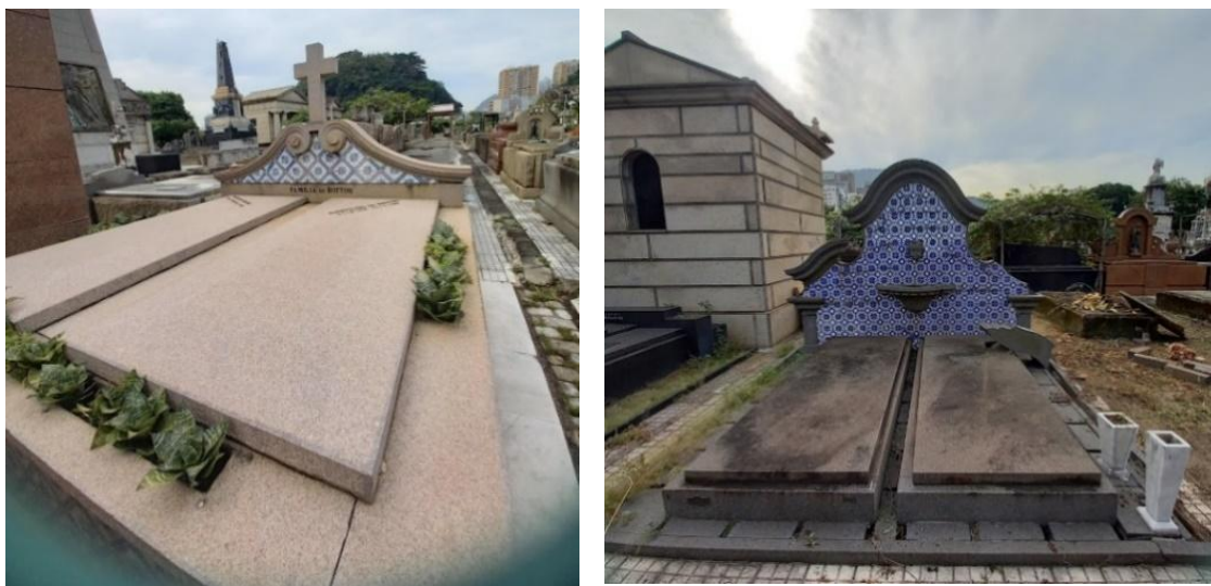
Figura 12: Túmulos Neocoloniais. Fonte: Stela Barthel, 2022.

A Figura 12 (a e b) mostra túmulos Neocoloniais, sendo o do lado esquerdo mais simples, com um frontão curvo, com frisos de pedra arrematados por volutas e um crucifixo em pedra e azulejos em branco e azul e um letreiro na base do frontão: Família De Botton. O do lado direito mostra um frontão curvo mais elaborado, também com frisos e volutas, azulejos em branco e azul, dois pilaretes, uma falsa fonte composta por uma pia e uma face (nas fontes verdadeiras, por onde a água deveria jorrar), ambas em pedra. Este encontra-se danificado, um dos frisos com voluta se desprendeu. Há ainda dois vasos em mármore branco, para flores.