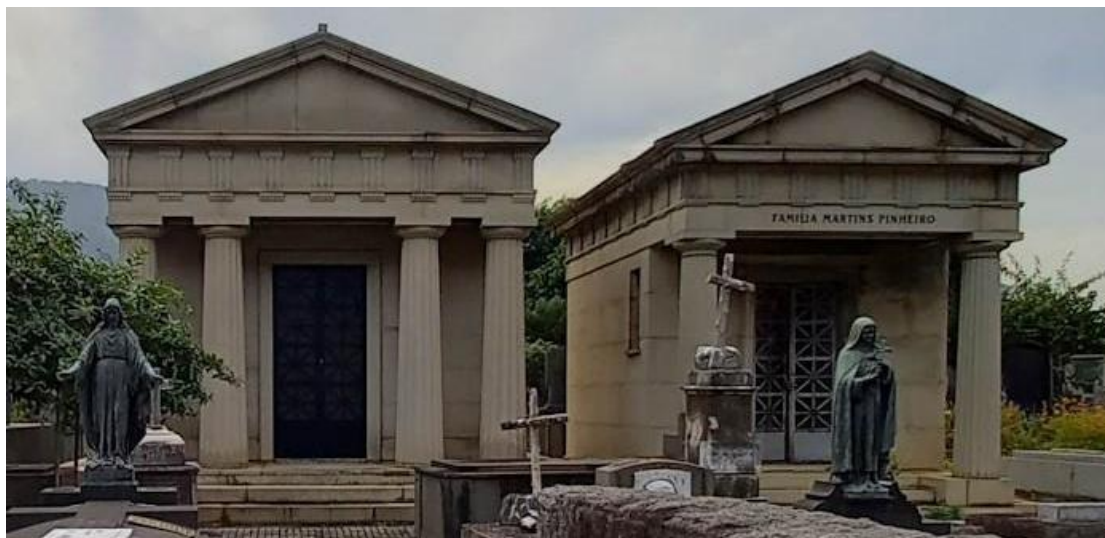
Figura 7: Mausoléus-Capela Neoclássicos.