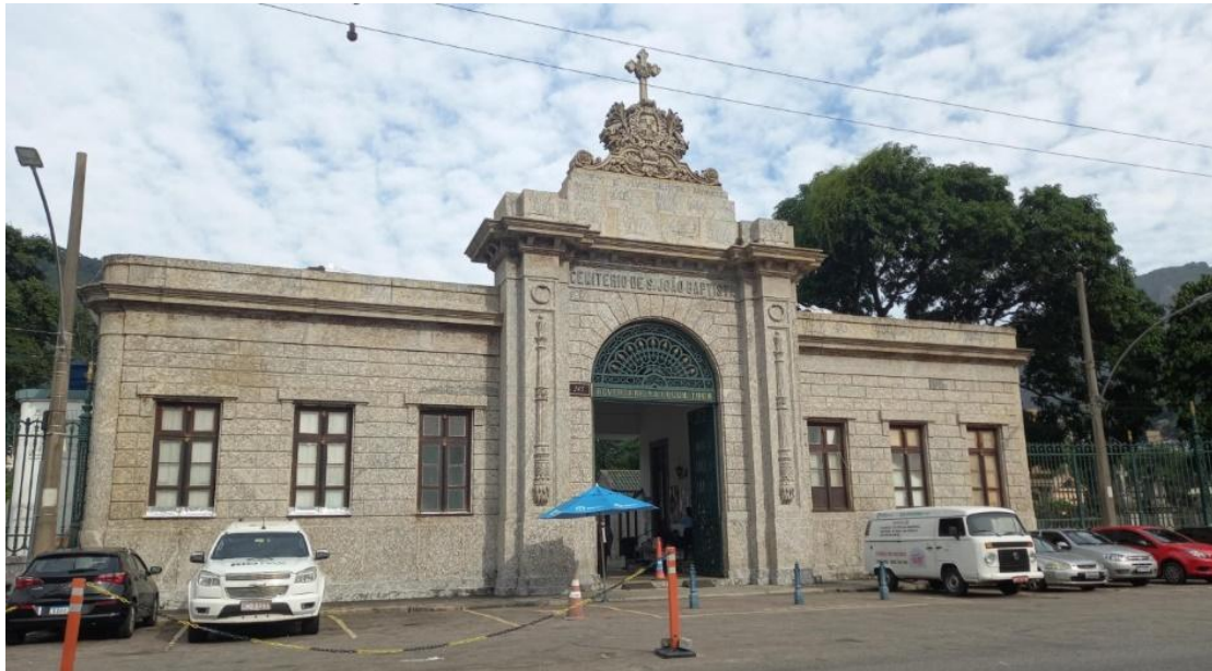
Figura 4: Entrada do Cemitério de São João Batista, Rua General Polidoro, bairro de Botafogo-RJ.

O Pórtico de entrada (Figura 4), construído em 1860, em blocos em granito, no estilo Neoclássico, é atribuído ao arquiteto carioca José Maria Jacinto Rabelo. Foi tombado pelo Instituto Estadual do Patrimônio Cultural (Inepac) através do Decreto nº. 6934, de 9 de setembro de 1987. Francisco Joaquim Béthencourt da Silva, em 1861, assumiu o cargo de arquiteto da Santa Casa de Misericórdia, que administrava o cemitério (Sobral Filha, 2015). A Igreja de São João Batista, pertencente ao cemitério, também foi projetada por ele.