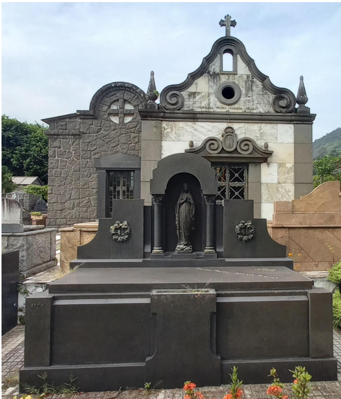
Figura 13: Mausoléu-Capela Neocolonial.