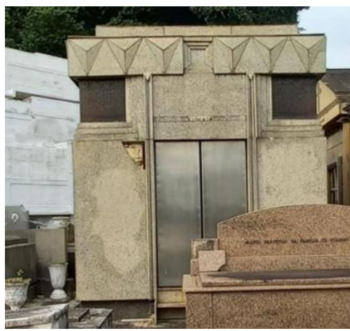
Figura 17 (a e b): Mausoléus-Capela Art Déco.

Os dois Mausoléus-Capela (Figura 18 – a e b) são feitos em pedra. O do lado esquerdo apresenta superposição de planos, com frisos nas laterais e composição geométrica, com uma abertura em formato de cruz. O do lado direito tem escalonamento no frontão, em forma de cruz, revestido de granito, detalhe que acompanha o arco pleno com frisos. Uma placa informa: “Manoel Gomes da Costa e os seus”. No tímpano, há um relevo em bronze, a porta é de metal com vidros, com elementos de adorno da flora, estilizados e medalhões, adornada por colunas da ordem Coríntia e há uma pequena escadaria.