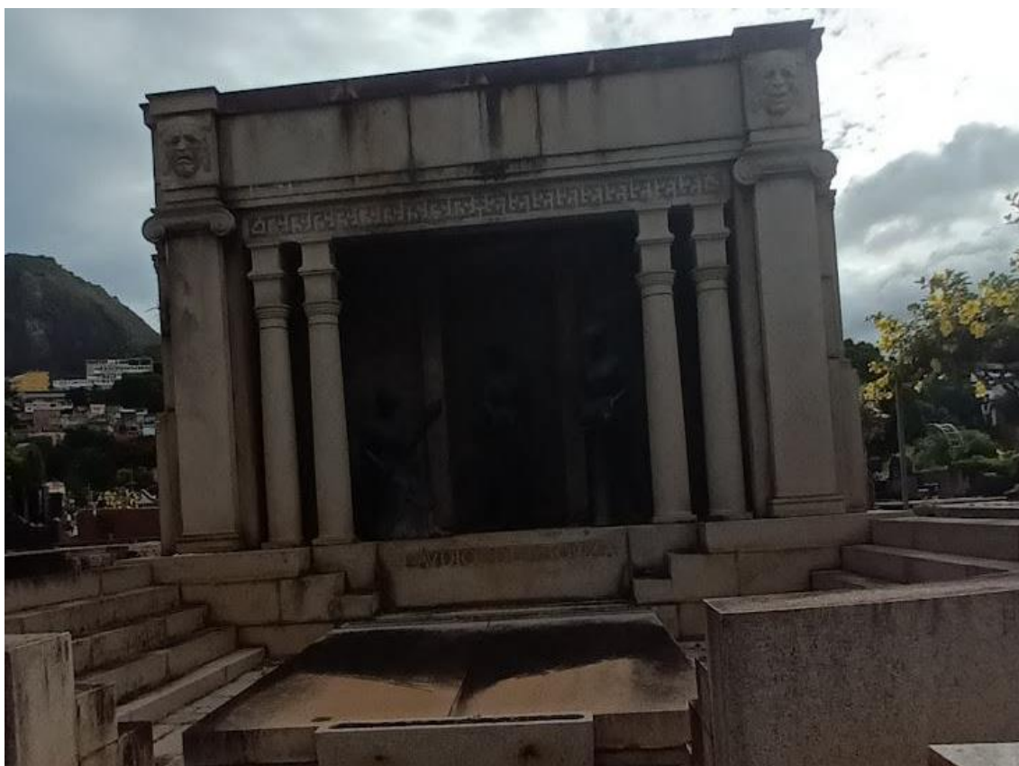
Figura 11: Mausoléu-Capela Eclético. Fonte: Stela Barthel, 2023.

O Mausoléu-Capela da Figura 11, do ator de teatro Cláudio de Souza, faz referência ao teatro, com as máscaras do riso e do choro na platibanda. O entablamento tem relevos e é sustentado por quatro colunas com capitéis estilizados e duas pilastras com capitéis Jônicos. Há uma espécie de varanda, onde estão posicionadas três estátuas de bronze e na frente, há um pequeno palco com arquibancada. O edifício foi construído em pedra.