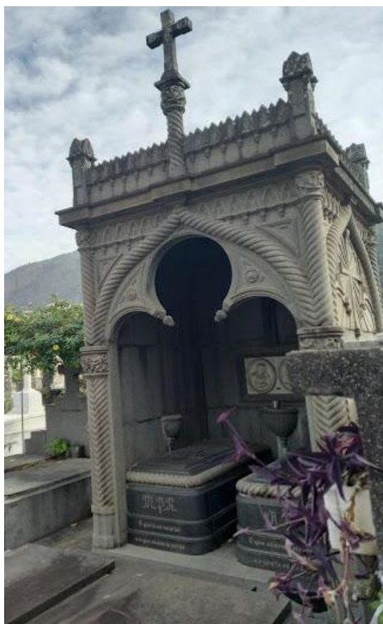
Figura 9: Mausoléu-Capela Eclético.

A Figura 9 mostra um Mausoléu-Capela Eclético, com arcos trilobados, em ferradura, característicos da arquitetura do Islã, também muito utilizados no Gótico com influências bizantinas. Há ainda arcos ogivais, adornados com um elemento em serpentina. Na platibanda, coruchéus, relevos e uma cruz em pedra. Adornos de guirlandas em pedra. O edifício de alvenaria de pedra é aberto, mostrando dois túmulos, com inscrições, medalhões e pias.