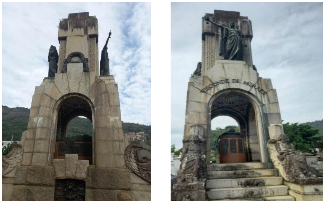
Figura 15 (a e b): Mausoléu-Capela Art Déco.

obras de arte, como estátuas, cúpula com mosaico de azulejos, relevos geométricos, guirlandas, letreiro etc. No interior, um pedestal em mármore, com uma estátua em bronze, deitada, simbolizando o morto. O edifício é feito em pedra e assenta-se sobre um pódio, com escadaria.