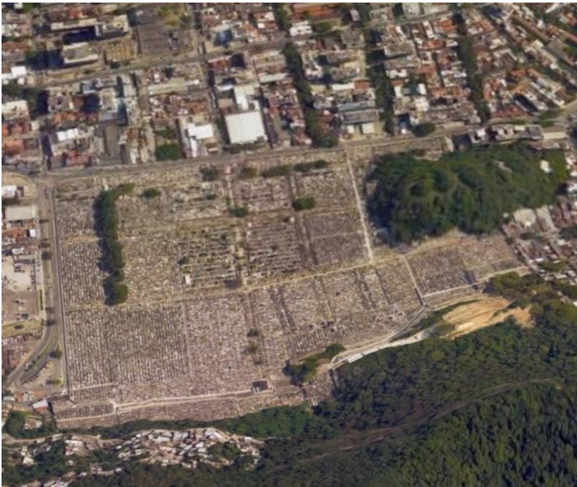
Figura 2: Vista aérea do Cemitério de São João Batista-RJ.

Localizado no bairro de Botafogo, entre duas vias importantes, a Rua Real Grandeza e a Rua General Polidoro, na Zona Sul da cidade do Rio de Janeiro, o Cemitério de São João Batista é o único da região. A Concessionária Rio Pax, que o administra desde 2014, informa que há 65.000 enterramentos nele, com 25.000 jazigos, cuja maioria é católica, embora ele seja multiconfessional. Existem ainda serviços de cremação, que acabam por diminuir a produção artística e arquitetônica, fenômeno que acontece atualmente em todo o mundo.