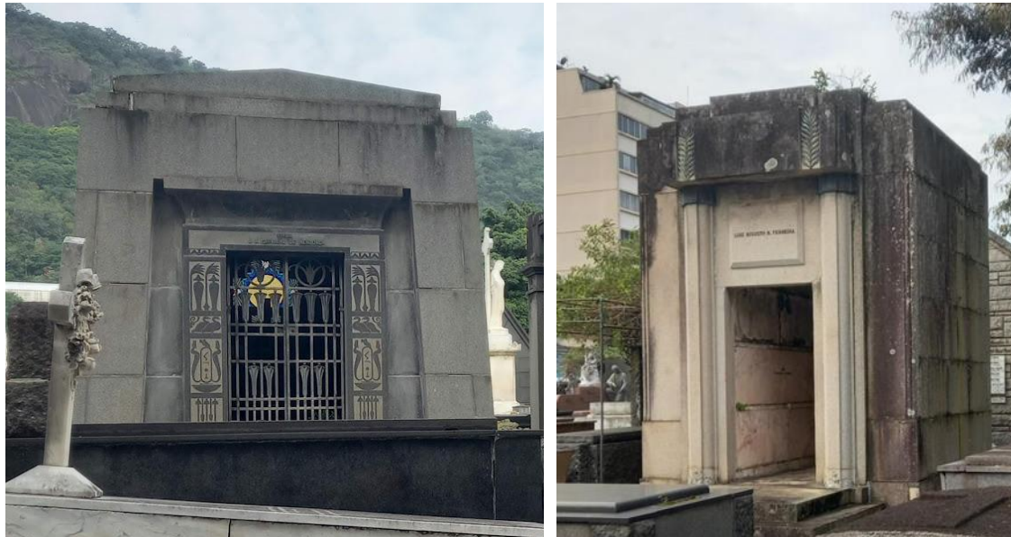
Figura 19: Mausoléus-Capela Art Déco.

Os Mausoléu-Capela (Figura 19) são em pedra. O do lado esquerdo faz referência ao Egito, com hieróglifos e paredes inclinadas e tem um letreiro: Família Carvalho de Mendonça. O edifício tem platibanda escalonada, um pórtico sobre a porta e grade em ferro, com flora estilizada (papiros, planta aquática do Rio Nilo). O do lado direito tem platibanda escalonada, adornada com elementos da flora estilizados, duas colunas adossadas, com capitéis e está pintado de Rosa. Encontra-se sem a porta.