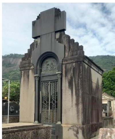
Figura 18 (a e b): Mausoléus-Capela Art Déco.